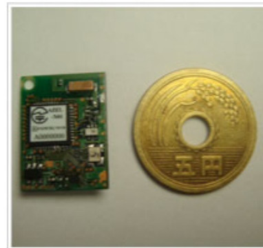
AZELと5円玉サイズ比較